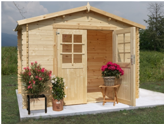
Casetta ambra cm 300x200 - Casette in abete grezzo - ESTERNI DA VIVERE